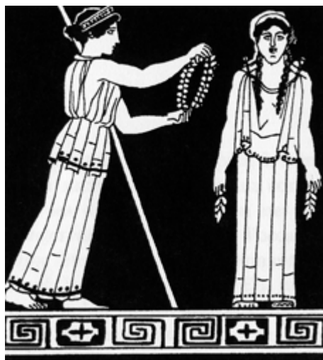
La déesse Athéna couronnant Pandore, la «première» femme. Vase grec du V e siècle avant notre ère.

Lorsque les premiers philosophes grecs mettront au point la rationalité, le Logos , le règne du Mythos se verra contesté et sera miné. La soif du sens est toutefois si viscérale pour l'être humain que le Logos n'aura sans doute jamais raison du Mythos .