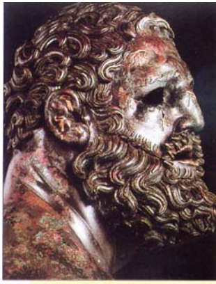
Milon de Crotoné